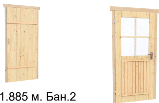
0.84×1.885 м. Бан.2 шт.