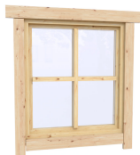
0.87×0.78 м.4 шт.