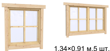
1.34×0.91 м.5 шт.