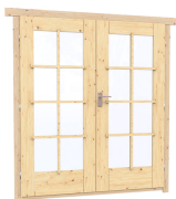
1.62×1.885 м.1 шт.

7. Наличники: сухая строганная доска 20×100 мм.;