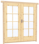
1.62×1.885 м.1 шт.

7. Наличники: сухая строганная доска 20×100 мм.;