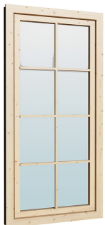
0.84×1.885 м.2 шт.