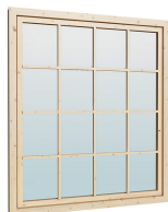
1.62×1.885 м.1 шт.